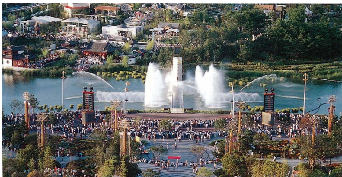
写真① 花博の中心部—手前花栈敷、中央いのちの海、向こう国際庭園

20世紀後半に行われた日本の国際博も、「人類の進歩と調和」をテーマとした大阪万博をはじめ、この流れの中にすべて位置づけられるものです。そして世紀末に行われた花博は、20世紀の国際博を総括するとともに、「自然と人間の共生」というテーマのもとに地球環境時代の人類という新しい視点を提供した博覧会として、新世紀への橋渡しを見事に果たしました。この視点は、今年愛知県で行われる万博（愛・地球博）のテーマ「自然の叡智」にも繋がっています。